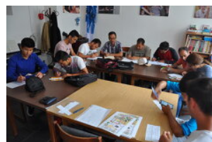
Comedor del Arte