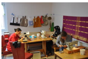
Comedor del Arte