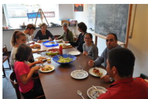
Comedor del Arte

Die Aktivitäten im Rahmen des Tu was, dann tut sich was. – Sozialfestivals haben uns gelehrt, dass es zwar mediale Aufmerksamkeit erzeugt, wenn man punktuell Veranstaltungen macht, dass interkulturelle Begegnung, Integration und soziale Vernetzung tatsächlich nur durch den regelmäßig, unverbindlich geöffneten Begegnungsraum passieren und wachsen.