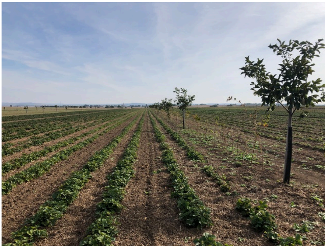
FiBL, T. Markut