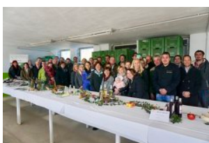
LAG innovationsRegion Murtal