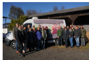
LAG innovationsRegion Murtal