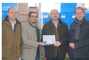
LAG innovationsRegion Murtal