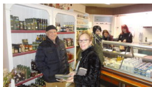
LAG innovationsRegion Murtal

Das Thema Versorgung der Bevölkerung mit regional erzeugten Produkten ist eines, das für alle Beteiligten sehr wichtig ist. Zum einen kann das Ernährungsbewusstsein der Bevölkerung unterstützt werden und zum anderen kann die Wertschöpfung in der Region gehalten werden. Damit verbunden kann das Fortbestehen von bäuerlichen Betrieben gesichert werden und damit ein wichtiger regionalentwicklungstechnischer Indikator abgesichert werden. Gerade im bäuerlichen Bereich können weibliche Arbeitsplätze mit diesen Initiativen gesichert werden und damit kann einer Abwanderung von weiblichen Arbeitskräften aus der Region entgegengewirkt werden.