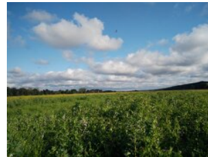
Bio Forschung Austria