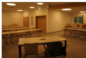
LEADER Region Weinviertel- Manhartsberg