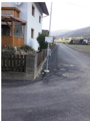
Region Großglockner/Mölltal - Oberes Drautal