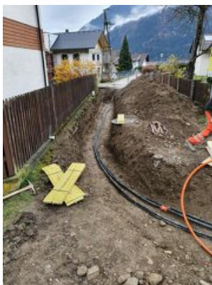
Region Großglockner/Mölltal - Oberes Drautal