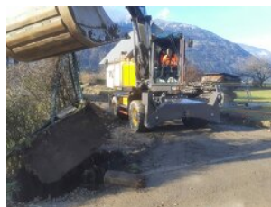
Region Großglockner/Mölltal - Oberes Drautal