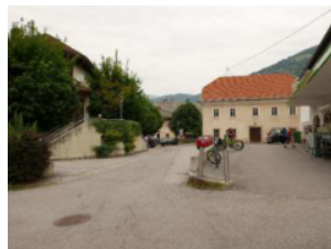
Region Großglockner/Mölltal - Oberes Drautal