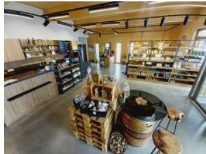
Sauwald Erdäpfel GmbH