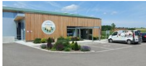
Sauwald Erdäpfel GmbH

Das Projekt umfasst die Planung und Anschaffung eines Besucherinnen- und Besucherzentrums in räumlicher Abgrenzung zum ebenso geplanten Erdäpfellagers, die Gestaltung eines Versuchsgartens, die Ausstattung des Besucherinnen- und Besucherzentrums mit Verkaufsraum, Küche, WC, Büro und Schulungsraum, sowie einen Imagefilm und Mediengestaltung.