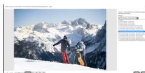
Oberösterreich Tourismus GmbH

Im ersten Schritt werden so Foto- und Filmproduktionen der Oberösterreich Tourismus GmbH für die Tourismusverbände über die Mediendatenbank zur Verfügung gestellt. Weiters haben die Tourismusverbände die Möglichkeit sich an der Mediendatenbank zu beteiligen, um auch selbst Medien hochladen und verwalten zu können. Nach dem Anschluss der interessierten Tourismusverbände wird auch anderen touristischen Betrieben (Hotels und Freizeiteinrichtungen) und Organisationen angeboten, sich an der Mediendatenbank zu beteiligen. Es wurden neue Stellen im Ausmaß von zwei Vollzeit-Äquivalenten durch das Projekt geschaffen, die über den Projektzeitraum nachhaltig gesichert werden können. Insbesondere betrifft das die Bereiche Projektleitung, Helpdesk sowie Grafikressourcen.