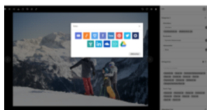
Oberösterreich Tourismus GmbH