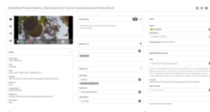
Oberösterreich Tourismus GmbH