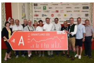
Region Urfahr West