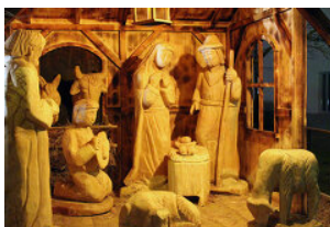
LEADER Mitten im Innviertel