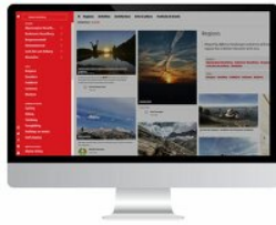
Social Guide Vorarlberg