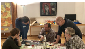
Nature of Innovation