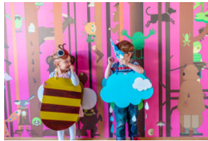
TVB Naturpark Zirbitzkogel-Grebenzen, Mediadome