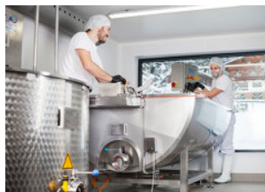
ce. studio für design und grafik