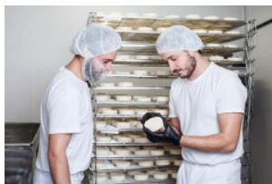
ce. studio für design und grafik

Als lehrreich empfinden wir den Kontakt zu unseren Besucherinnen bzw. Besuchern und Kundinnen bzw. Kunden und welchen Reibungspunkten die heutige moderne Landwirtschaft ausgesetzt ist. Deswegen empfinden wir es als extrem wichtig hier anzusetzen und Aufklärungsarbeit zu leisten. Dadurch soll es ersichtlicher werden, was sich alles in unseren Höfen abspielt und wie viel Arbeit dahinter steckt, hochwertige Lebensmittel zu produzieren.