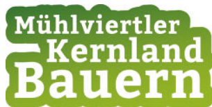
Verein Mühlviertler Kernlandbauern

Integration eines Blog über regionale Produkte und ihre Herkunft: "Meine kulinarische Entdeckungsreise im Mühlviertler Kernland".