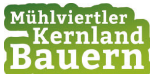
Verein Mühlviertler Kernlandbauern

Integration eines Blog über regionale Produkte und ihre Herkunft: "Meine kulinarische Entdeckungsreise im Mühlviertler Kernland".