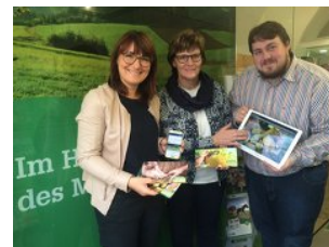
Regionalverein Mühlviertler Kernland