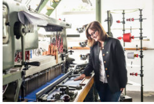
Waldviertel Tourismus, Robert Herbst