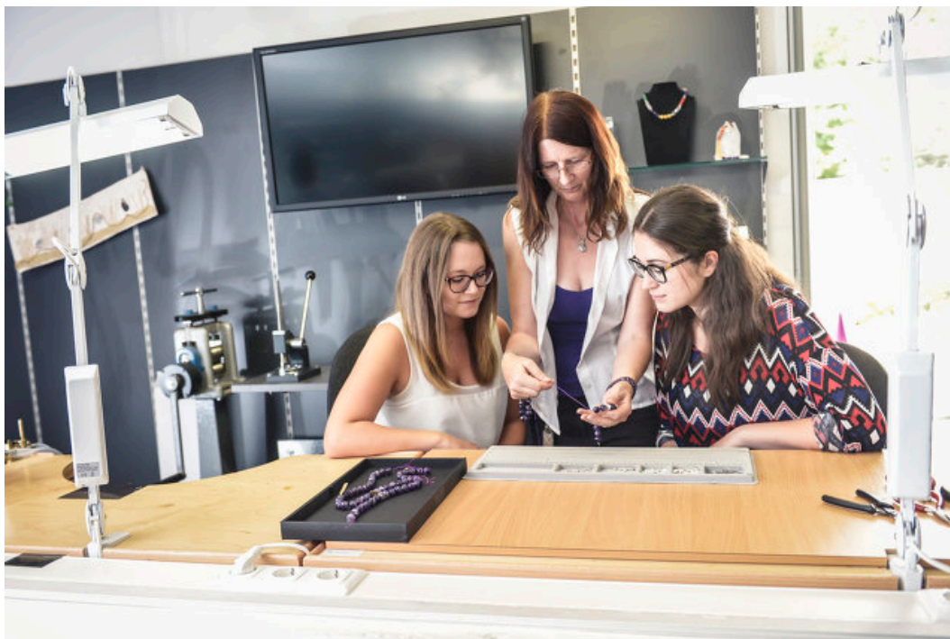
Waldviertel Tourismus, Robert Herbst