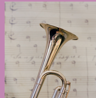
- SCHMETTERT -