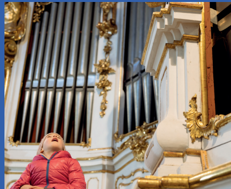
- BEWEGT -