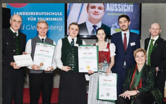
1. bis 3. Platz im Service – alle Lehrlinge aus einem Betrieb der „Ausgezeichneten Lehrbetriebe im Tourismus“

Das Gütesiegel „Ausgezeichneter Lehrbetrieb im Tourismus“ ist die Zusammen- arbeit von jenen Tourismusbetrieben, die weit mehr bieten als eine normale Lehre. Auf dem Programm stehen beispielsweise Zusatzausbildungen, Seminare mit Stars aus der Branche oder der Lehrlingsaustausch. Mit dem „Rogner Bad Blumau“, dem „Gasthaus Haberl“ aus Walkersdorf und dem „G'sund & Natur Hote DIE WASNERIN“ aus Bad Aussee stellen gleich drei Mitgliedsbetriebe die Hälfte der Landesmeister.