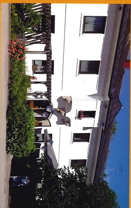
Das Haus mit dem sprechenden Namen „Zum feuchten Eck“ wurde bereits 1260 erstmals urkundlich erwähnt.

Das macht dieses Phänomen der Erdställe aber nur noch interessanter und lässt weiterhin genügend Raum für Interpretationen und neue Theorien.