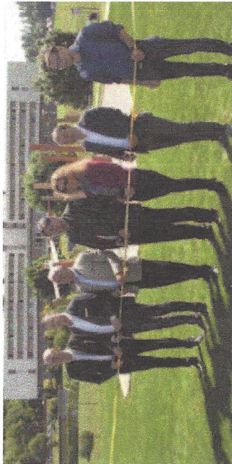
Feierliche Eröffnung de Bewegungsparks Lipizzanerheimat.

In unmittelbarer Nachbarschaft der Therme NOVA wurde heuer der Bewegungspark Lipizzanerheimat im Beisein von VertreterInnen aus Politik, Wirtschaft, Gemeinden und Schulen feierlich eröffnet.