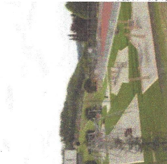
Tolle Angebote für jede Zielgruppe.

Vor zwei Jahren wurde die Projektidee erstmals von einem Projektteam der Stadtgemeinde Köflach der LAG Lipizzanerheimat