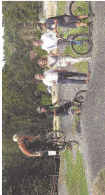
Die Pump-Track-Anlage erfordert schon einiges an Training und Können.

In Ligest konnte eine Pump-Track-Anlage als weiterer Erlebnispunkt in der Lipizzanerheimat mit Unterstützung von LEADER-Mitteln umgesetzt werden.