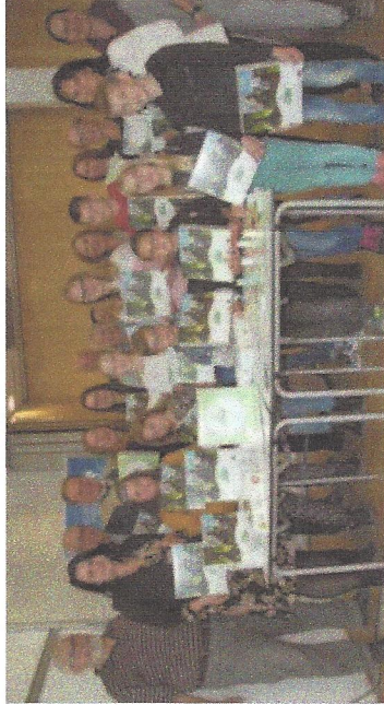
Die Kinder waren vom Endprodukt des Spiels begeistert.